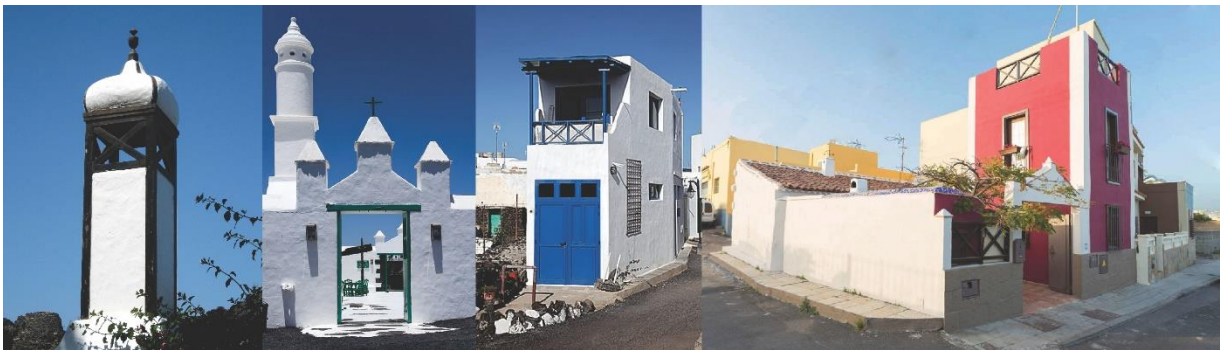
Fig.1: Fotografías referenciales de viviendas en Lanzarote, Canarias.

La cita se mantiene vigente incluso en la arquitectura que no funda en el conocimiento disciplinar su acción proyectual, en ella se utilizan como referencia fenómenos de la naturaleza u objetos industriales. (2002).