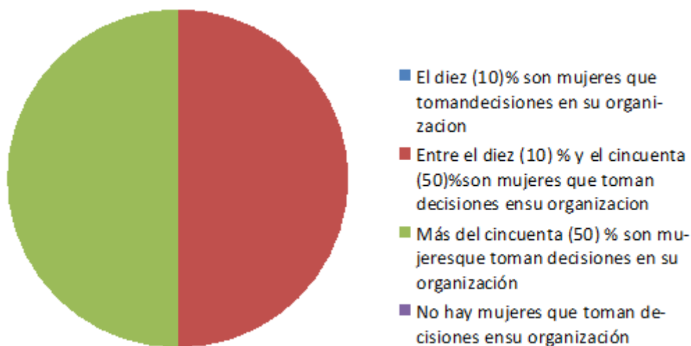
Gráfico 1. Cuestiones de género en el perfil de la organización.

Respecto a su estructura de personal todas las empresas indicaron que existe diversidad cultural en el personal contratado, por ejemplo empleados inmigrantes, jóvenes, adultos mayores en su reinserción, orientación sexual, etc. En lo que respecta al género se infiere el rol relevante de las mujeres en el proceso de toma de decisiones (Gráfico 1).