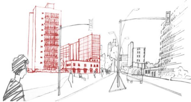
Fig. 1- Mirada y memoria, el boceto desde la percepción de la realidad. Fig. 3- La construcción de los conceptos desde el registro gráfico

La captación del espacio urbano y las múltiples lecturas de sus dimensiones nos permite un trabajo interpretativo que posibilita entender la compleja relación socio-espacio-temporal de la ciudad que en nuestro caso se aborda desde una síntesis conceptual que permite el boceto. En el plano del proyecto no hay acción sin imaginación, el proyecto supone una esquematización de fines y de medios, que podríamos llamar esquema conceptual.